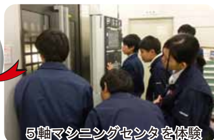
5軸マシニングセンタを体験